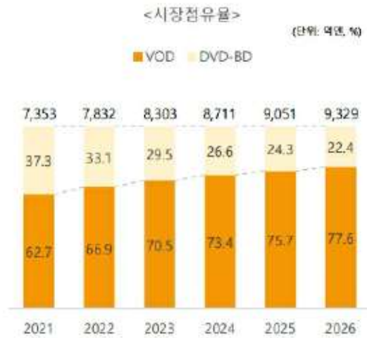
[일본 DVD 및 VOD_시장점유율 전망]