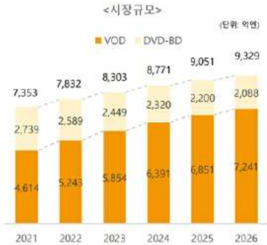
[일본 DVD 및 VOD_시장규모 전망]