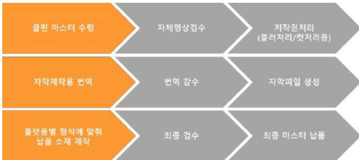
당사 배급 구조

많은 국내 제작사 및 방송사들이 국내 배급시장보다 까다로운 요구사항을 제시하는 일본 미디어 시장을 이해하지 못하는 것이 현실이며, Global OTT 플랫폼에도 적시에 배급을 실패하는 등, 현지시장 진입 자체에 많은 어려움을 겪고 있습니다. 반면 당사는 영상편집팀, 자막 제작 및 감수팀은 약 10,000여명이 넘는 작품의 영상편집, 자막, 감수진행 등의 노하우를 바탕으로, 빠르고 신속하게 Amazon Prime Video, NETFLIX, hulu 등 각 플랫폼별 높은 수준의 요구사항에 맞춰 원스톱 배급을 진행하고 있습니다. 이처럼 당사는 고객사별 니즈에 맞추어 커스터마이징을 진행할 수 있는 조직·인력·기술을 자체적으로 확립하여 현지 사정에 최적화된 배급 시스템을 구축하였습니다.